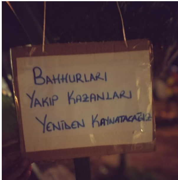
Ali İsmail Korkmaz Akdeniz Armutlu Koord. Merkezi'ndeki bir döviz.