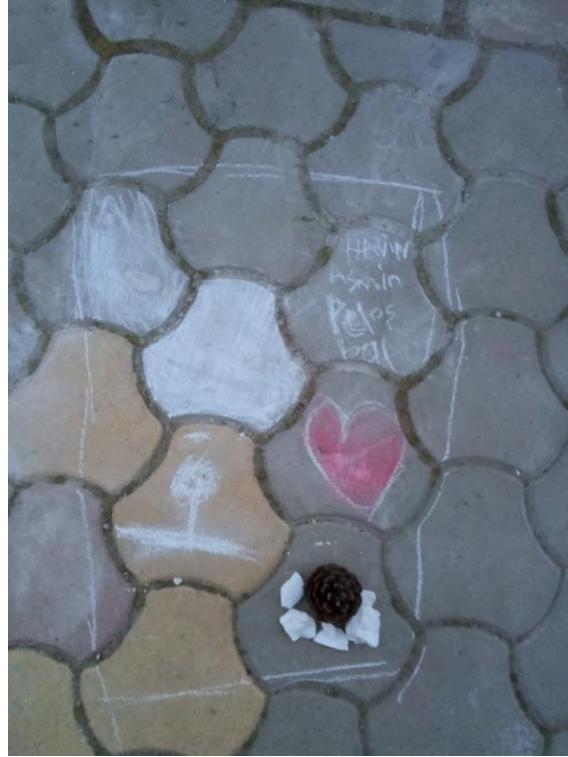
Çocukların oyunundan bir kare.

Artırılabilir bu örneklerde bireylerin birincil ya da nispeten uzak çevrelerindeki kayıplarının psikolojik yükünün söz konusu deneyimlere kalıcı biçimde eşlik edebileceği unutulmamalıdır. Örneğin, arkadaşlarının ve/ya öğretmenlerinin vefatının bilince olan çocuklarda eğitim beklentilerinin yeniden kurulumu zorlu bir süreci imlemektedir. Buna göre, örneğin yeni bölgelere göç eden kişilerde çocuklar açısından okullaşmadaki riskler göz önünde bulundurulmalıdır. Bireysel ve kolektif veçheleriyle travmatik bu deneyim içinde belirsizlik ile başa çıkmada, kamu otoritelerine her zamankinden fazla ve çeşitli roller düştüğü kanısındayız. Yukarıdaki iki örnekten pay biçersek, ahlaki ve etik bir sorumluluk çerçevesinde, şehir planlama ve kriz dönemi sürecinde eğitim politikaları mevcut yaraları sarmaya ve umudu yitirmeye hizmet etmelidir. Yıkıma yol açan rant siyasetinin üzerine yeni rant kavgaları kentlerini de yitirmiş kişilerin 'yasına' merhem olmak bir yana, acı ve kederlerini tırmandıracak yanlışlar olabilir. Gerçekçi, şeffaf, güven veren ve umut aşıl原因 hak temelli politikaların izlenmesi depremden etkilenen halkın belirsizlikle baş etme becerilerini destekleyici olabilir.