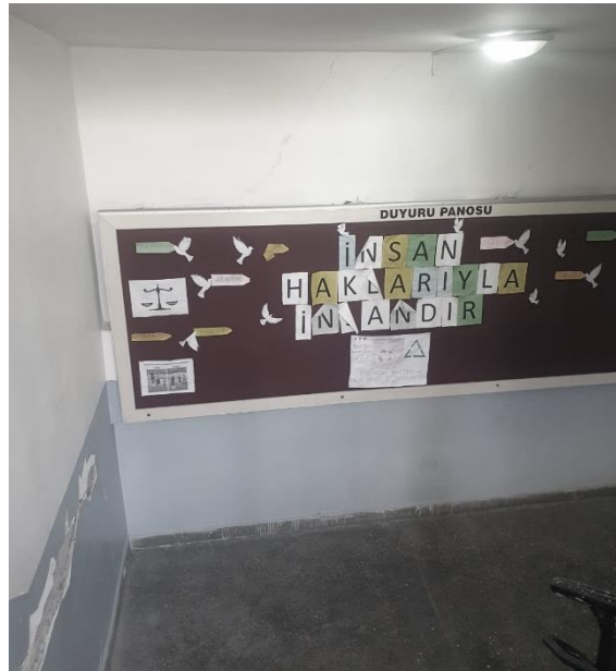
Deprem bölgesinde koordinasyon merkezi olarak kullanılan bir okuldaki duyuru panosu.